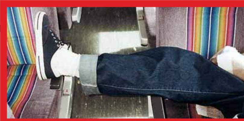
• Met de voeten op de stoel... Rekening houden met anderen, het blijft moeilijk.