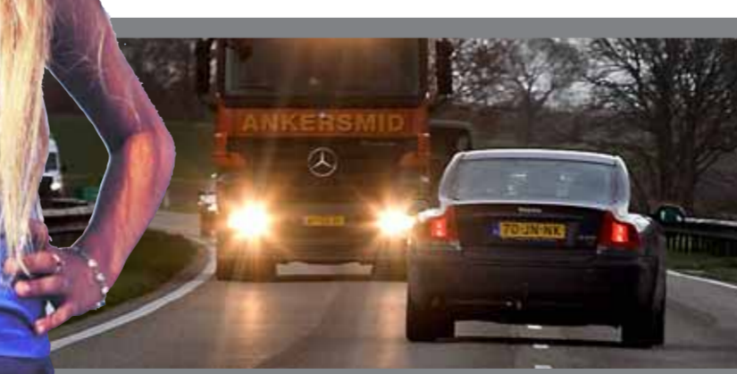
• Bumperkleven, het staat bovenaan in de toptien van dagelijkse ergernissen en onbeschoft gedrag op de weg.